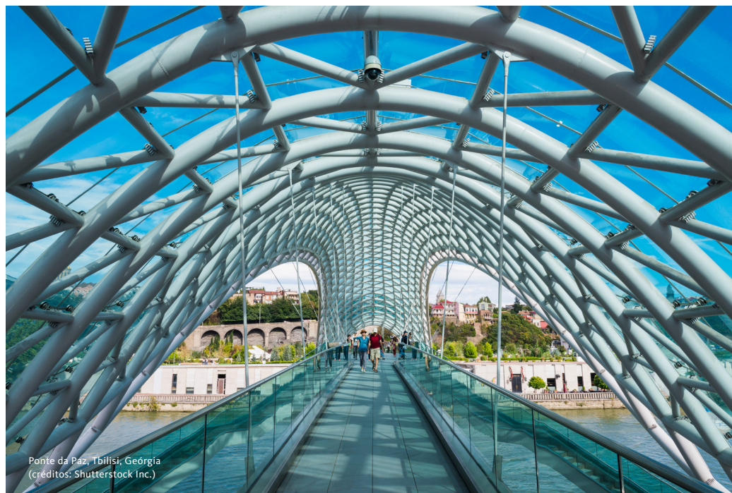
Ponte da Paz, Tbilisi, Geórgia