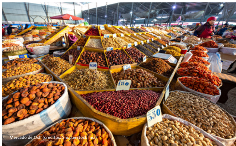
Mercado de Osh