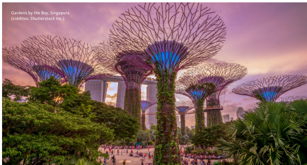
Gardens by the Bay, Singapura