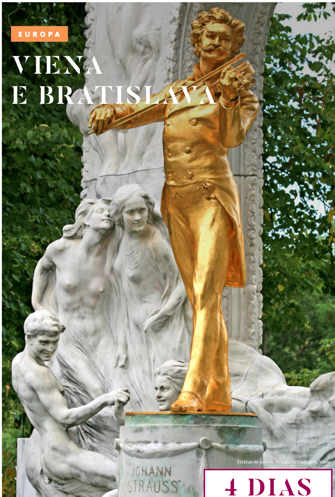
Estátua de Johann Strauss no Stadtpark, Viena