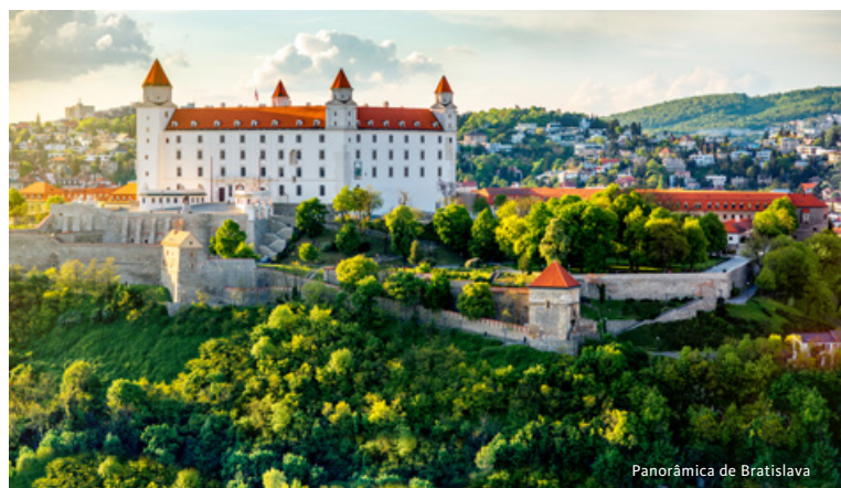
Panorâmica de Bratislava