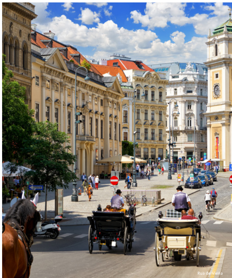
Rua de Viena