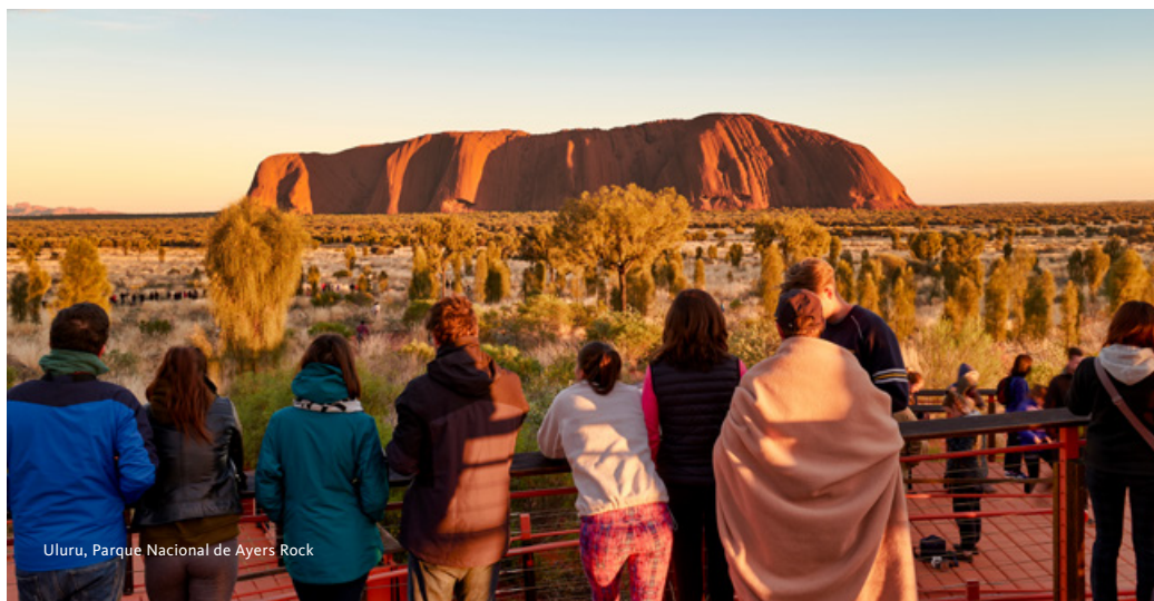
Uluru, Parque Nacional de Ayers Rock

Alojamento no Hotel DoubleTree by Hilton Darwin 4* ou similar.