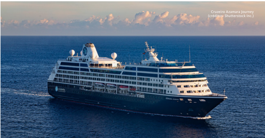
Cruzeiro Azamara Journey