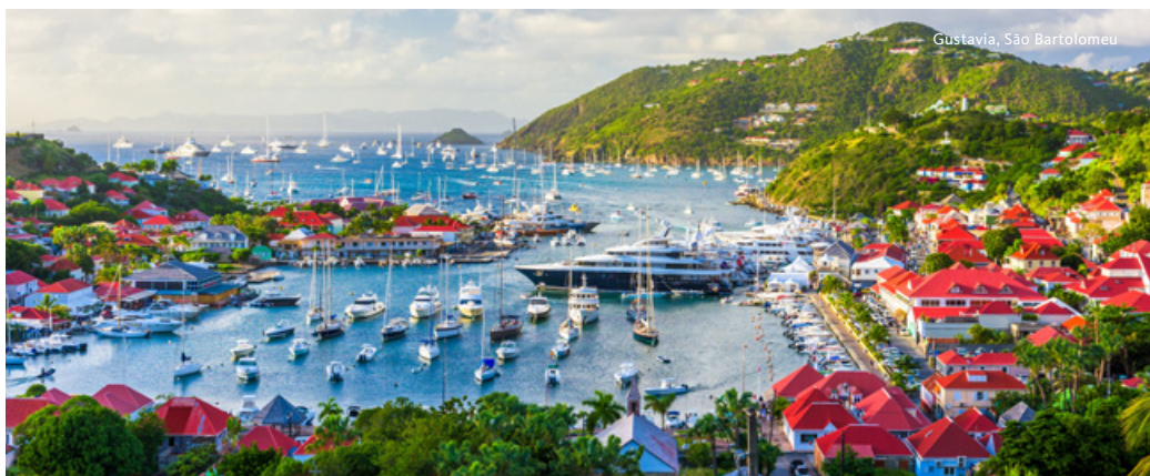
Gustavia, São Bartolomeu

um banho nas fontes termais alimentadas pela atividade vulcânica da ilha, ou explore o mercado, onde se vendem artesanato local, especiarias e produtos típicos. Pensão completa a bordo.