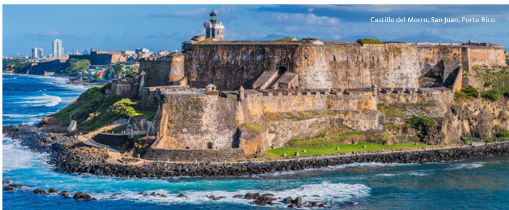
Castillo del Morro, San Juan, Porto Rico