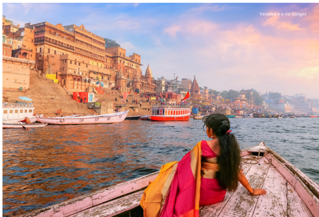
Varanasi e o rio Ganges

Transfer ao aeroporto de Jaipur para embarque em voo com destino a Varanasi, via Deli, a antiga Benares, cidade santa do hinduísmo situada nas margens do Ganges, o Rio Sagrado. Almoço. Regresso a Varanasi. Ao final da tarde, saída para observar a cerimónia Aarti nas margens do Ganges, onde são lançadas ao rio