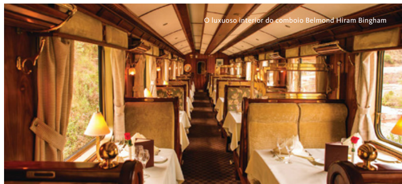
O luxuoso interior do comboio Belmond Hiram Bingham